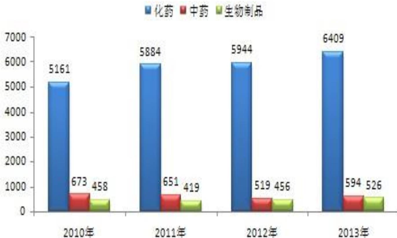
图1 2010至2013年各年度受理审评任务情况